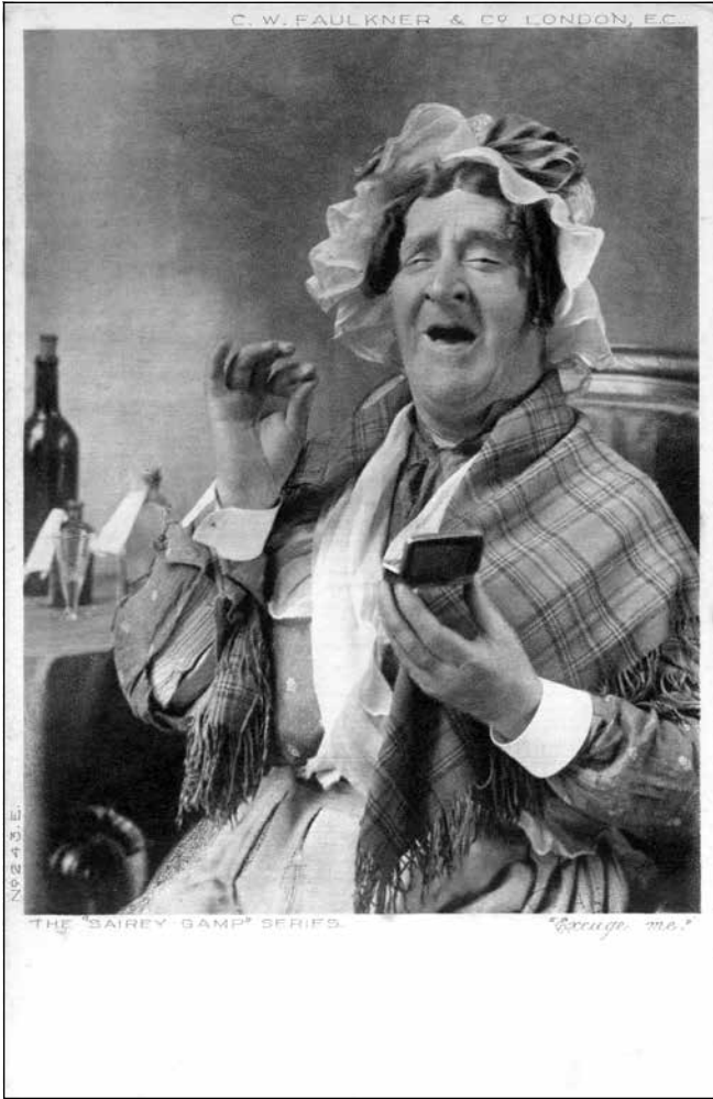
Fig. 6. ANON., Excuse me , collection « The Sairey Gamp Series », carte postale (héliogravure) imprimée par C.W. Faulkner & Co., Londres, c. 1900.