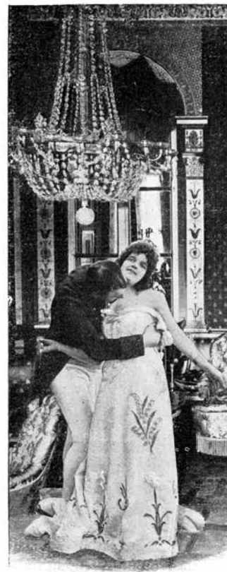
Fig. 2, 3 et 4. ANON., Capricieuse et attristée, elle rêvait des heures dans les bois, au bord des lacs , photographie (simili. en bleu), Napoléon, en somme n'aima réellement que Joséphine et Mme Waleska (collage), sans titre (simili.), reproduites dans Femmes galantes, scènes reconstituées par la photographie d'après nature , seize livraisons [sans indication de périodicité], sans nom d'éditeur, s. l. n. d. [1900-1901], s. p.

C'étaient souvent des actrices des théâtres des villes où l'on passait ; des bourgeoises que le récit de ses exploits avait rendues amoureuses du grand homme et qui, dans les rues et les sa-