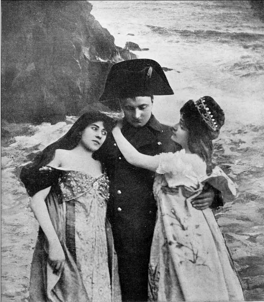
Napoléon, en somme, n'a ima réellement que Joséphine et Mme Waleska.