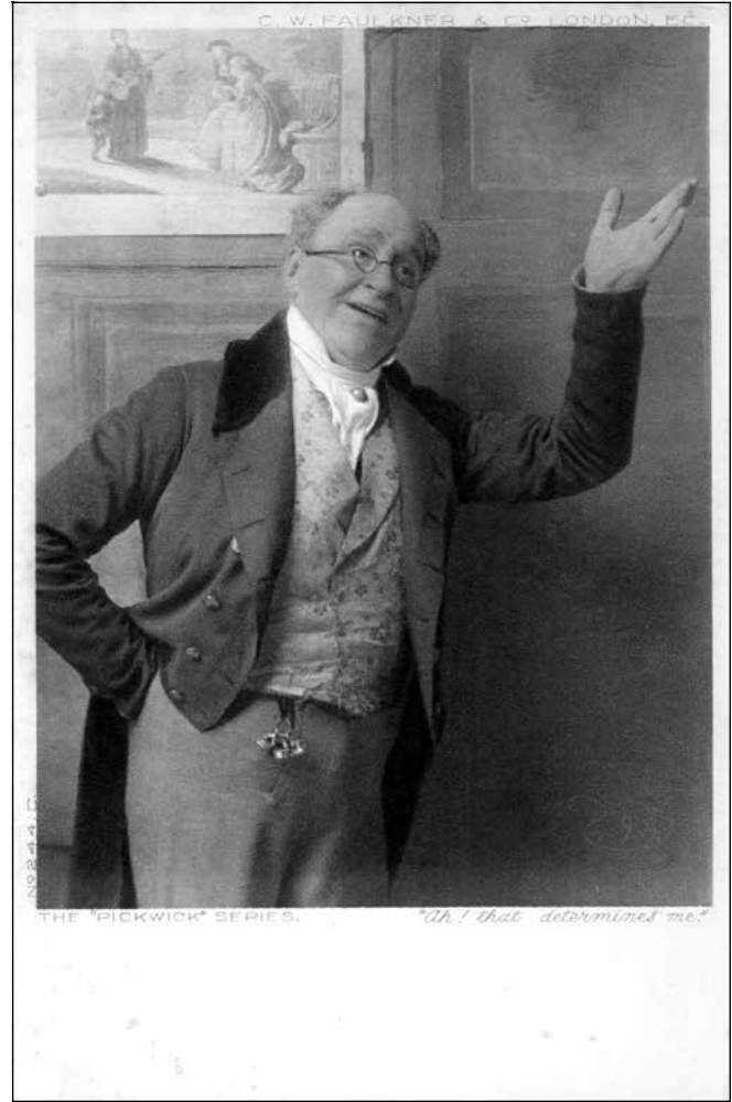
Fig. 7. ANON., Oh! That determines me , carte postale représentant Pickwick (d'après le roman de Dickens), imprimée par C.W. Faulkner & Co., Londres, c. 1900.

poète. La photographie est mise en valeur à cause de son contact direct avec le monde, et présente donc un avantage sur le dessin, comme le rappellent maints avant-propos éditoriaux et comptes rendus louangeurs. La forme prise par leurs productions reflète le marché du livre et, surtout, l'industrie naissante du tourisme des classes moyennes. La vue, déjà tirée en masse pour les collectionneurs et pour les touristes voulant un souvenir d'Écosse ou d'Italie, pouvait être contrecollée dans des éditions d'auteurs populaires. Le prix des ouvrages était élevé, mais pas exorbitant, leur luxe était modulable (nombre d'épreuves réduit ou élevé, cartonnage éditeur ou plein cuir ouvragé); ils s'adressaient au bibliophile, au touriste, et s'offraient pour étrennes. La formule était économiquement viable et ces productions ont trouvé leur public pendant plus de trente ans (1860-1890, et au-delà, si l'on compte les éditions comportant des reproductions photomécaniques de qualité). De plus, les normes du pittoresque