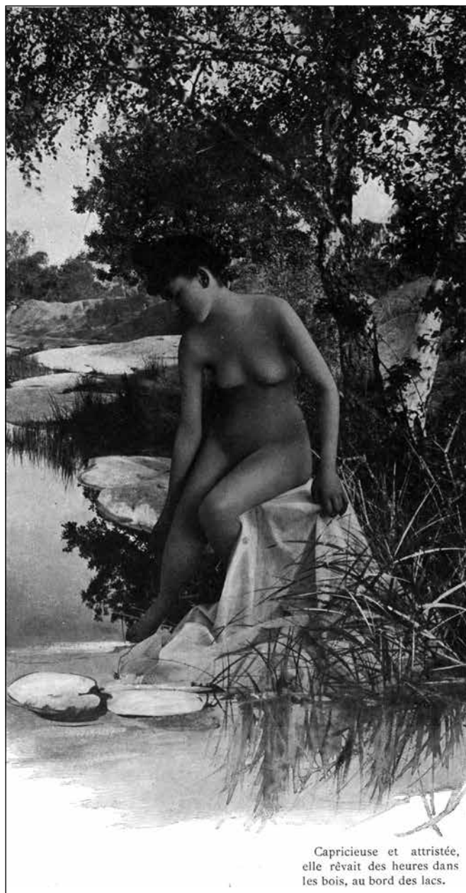
Capricieuse et attristée, elle rêvait des heures dans les bois, au bord des lacs.

révolté le doux et tiède obstacle de leur chair pâmée, de leur corps amoureux dont il usait une seconde, une seconde amère, brève, cruelle parfois, sans jamais détourner les yeux de son ambition et vibrer autrement sur la gorge d'une femme que du désir effréné de la conquête et de la gloire !