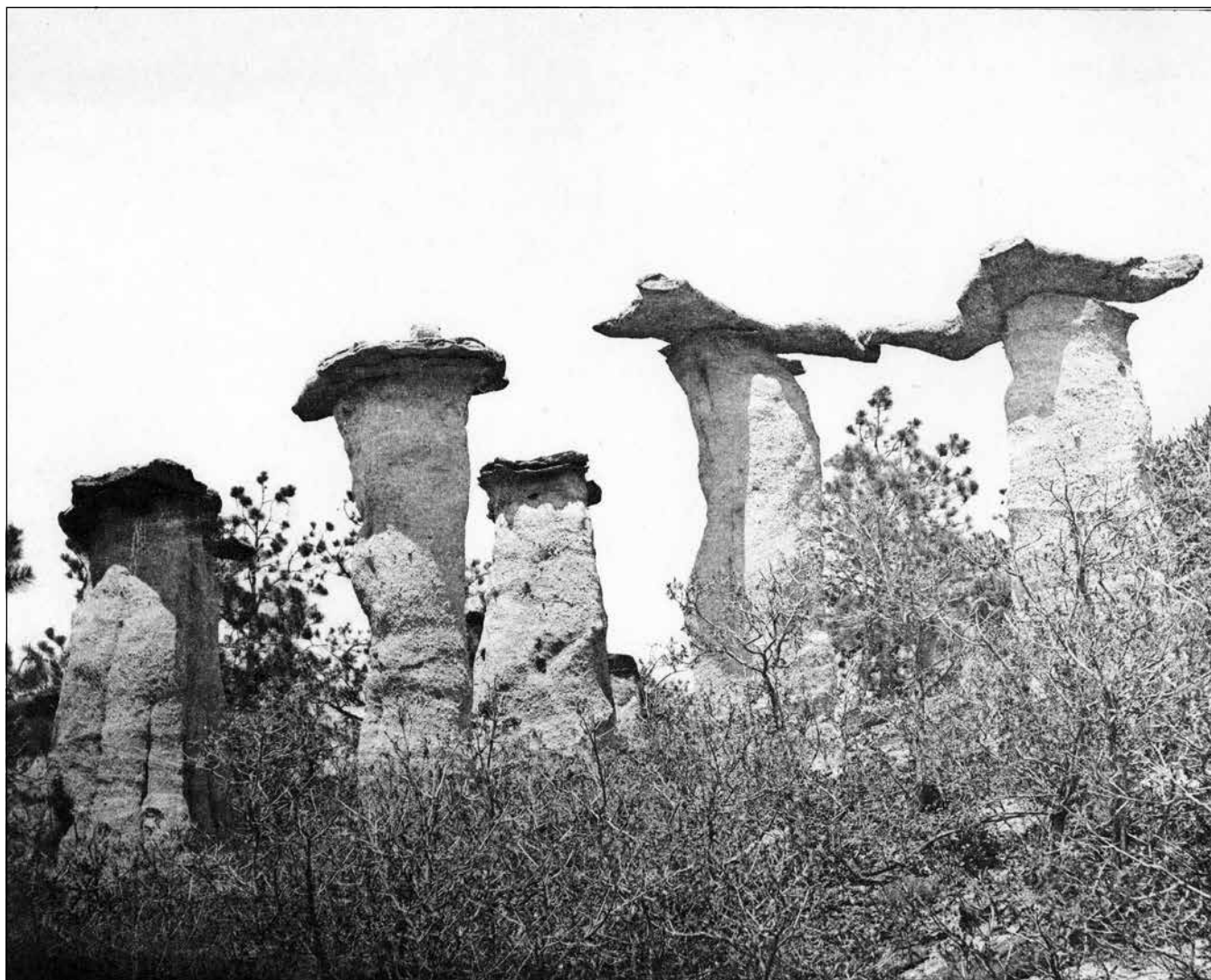
Fig. 1. W.H. SANFORD, photographie sans titre (phototypie), reproduite dans Ernest Whitney, Pictures and Poems of the Pike's Peak Region , chez l'auteur, Colorado Springs, 1891.

introduit cette fois comme l'agent tout-puissant d'un art tout nouveau, qui produit ces travaux incroyables. [...] nulle main humaine ne pourrait dessiner comme dessine le soleil 20 », puis plus prosaïquement chez Gustave Planche en 1857 : « l'œuvre du soleil, envisagée comme document, est une chose excellente 21 ». Toujours en évoquant l'animisme de la nature, Édouard Thierry écrit en 1859 : « L'image qui se fixe sur la plaque sensibilisée, c'est l'objet lui-même qui la dessine en se regardant 22 . » Cette communion de la nature avec elle-même (faisant fi du photographe) donnera naissance à une gamme d'idées qui vont du témoignage impartial jusqu'au fétichisme, dont l'héritier sera – mais pas seulement – le portrait dans la fiction.