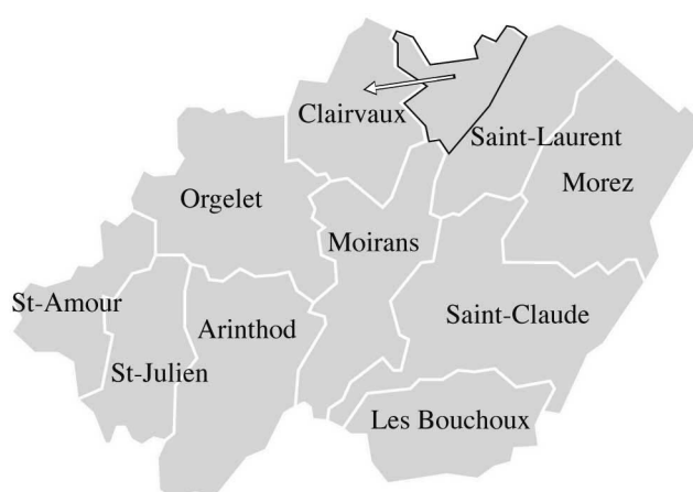
carte 2. — Cantons et « cantons fictifs » cadre de l'étude.

en l'an X, structures beaucoup plus durables – elles sont restées à peu près inchangées jusqu'à nos jours. Mais ce choix entraînait d'autres difficultés : en effet, des modifications administratives mineures étaient intervenues, et il a fallu corriger les limites des cantons de Saint-Amour, de Clairvaux et de Saint-Laurent pour les inscrire parfaitement dans les anciens districts, donnant ainsi naissance à des « cantons fictifs », monstres administratifs certes, mais fort utiles dans le cadre de la présente étude 53 .