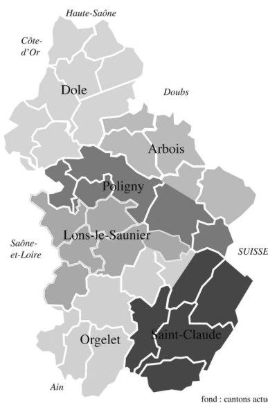
carte 1. — Département du Jura : les districts en 1790

La carte administrative de 1790 permet de les situer.